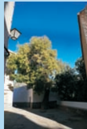
Almeceas en las calles de las Torres

Continuamos nuestro paseo por la senda y observamos que los bancales, hoy en día muchos enzarzados, son de escasa anchura, los ribazos y márgenes están sembrados de almeceas ( Celtis australis ) y granados ( Punica granatum ), que toman una tonalidad única en otoño mostrando colores ocre y rojizos, y son el refugio perfecto de numerosos pajarillos.