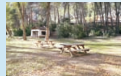
Área recreativa del Control de la Graya.