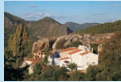
Meseta donde se levantaban las Torres

La ruta se inicia en la aldea de Las Torres, núcleo perteneciente a la pedanía de la Graya, al pie de la cara noroccidental de la sierra de Lagos. Enfrente se encuentra la Muela de Paúles, separada por el estrecho y encajado cauce del río Segura, nuestro destino en este paseo. Un paseo que comienza junto a las escuelas del pueblo y que continúa por las calles construidas en torno a la meseta, recorriendo los pasos del GR-68 (Los Serranos). Pasamos por la ermita, que dejamos a un lado para salir del núcleo de población cogiendo una senda que continúa a la derecha de las casas. Ya de bajada nos encontramos con el camino que sube a las ruinas o antiguo enclave de lo que fue una fortaleza con cinco torres. Rigurosos estudios nos hablan del camino de acceso desde la aldea, con un muro perimetral que se apoyaba sobre el cantil natural de la meseta y una torre en el punto de acceso. Desde esta, observamos a espaldas del poblado la Molata o Muela, inconfundible escarpe calcáreo que es otro de los yacimientos que se encuentran en lo alto de la sierra de Lagos. Al oeste, las vistas que se pueden apreciar son del Calar de la Sima y más próximo al sur el Puntal de Rodas.