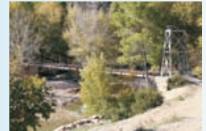
Puente colgado, río Segura.

Dejamos la senda para llegar a las casas de la cuesta donde el camino ahora discurre por calles y baja paralelo al arroyo del Alaruque hasta llegar a la carretera que se encuentra ya en las casas del río. Desde aquí solo 370 metros a la derecha nos separan de nuestro destino final, el río Segura y su puente colgado, que data de 1960, donde podrás darte un chapuzón en sus aguas cristalinas o parar a descansar en el área del Control de la Graya, (nombre que se le atribuye a una antigua zona de control de mercancías procedentes de los aprovechamientos madereros), al otro lado de la orilla.